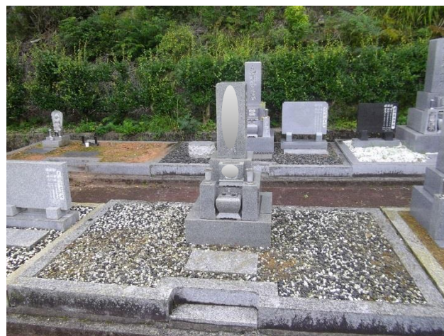
(墓地内草取り 後 墓石あり)