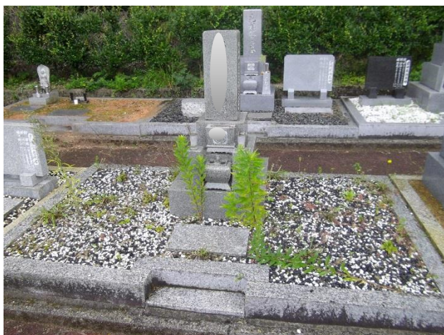
(墓地内草取り 前 墓石あり)

☆ 身体の具合が良くない、仕事が忙しい、遠方に住んでいるなどで、なかなかお墓参りができない方に代わり、お墓の管理を代行いたします。