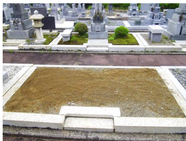
(墓地内草取り 後 墓石なし)